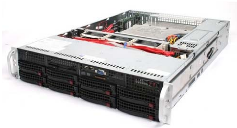
高性能服务器式系统实物图（1）